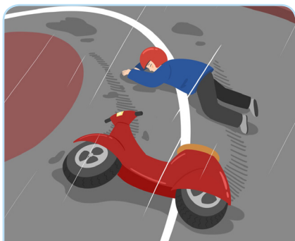
급한 커브 및 핸들 조작으로 인한 미끄러짐