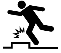
걸려 넘어짐 주의