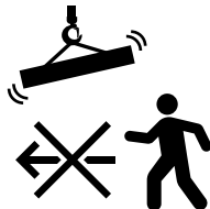
크레인 하부 통행금지