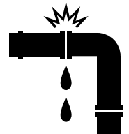
배관 접합부 누출 점검