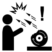
가공물·가공날 맞음 주의