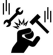
물체 맞음 주의