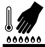
화상 주의(고온부 접촉 금지)