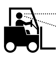
운전자 시야 확보