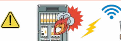
전력이상 감지장치 전 업종