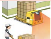
무인운반차 등 이동형 위험설비