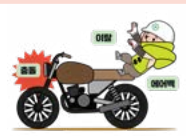
이륜차(배달, 택배업 등)