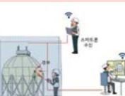
인화성 가스 감지기(고정식/이동식)