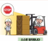
자동 서행 및 정지장치