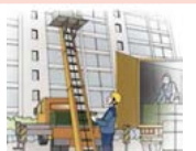
이삿짐 운반용 리프트