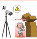
이동식 끼임·충돌 위험구역(건설업 본사)