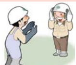
귀마개 소음작업(85dB 이상)