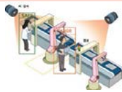
고정식 끼임·충돌 위험구역