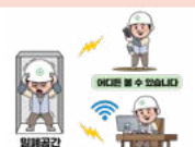
밀폐공간 (화재·폭발장소 제외)