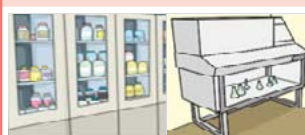
환기설비 통합시스템 화학공정 또는 실험·연구실