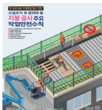
지붕공사 주요 작업안전수칙