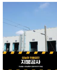
지붕공사 작업 재해예방