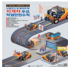
지게차 주요 작업안전수칙