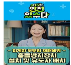
지게차 부딪힘 재해예방