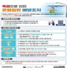
2025년 온열질환 예방지침