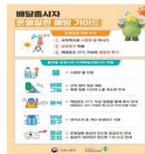
배달종사자 온열질환 예방가이드