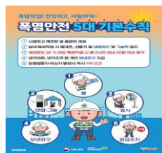
폭염안전 5대 기본수칙